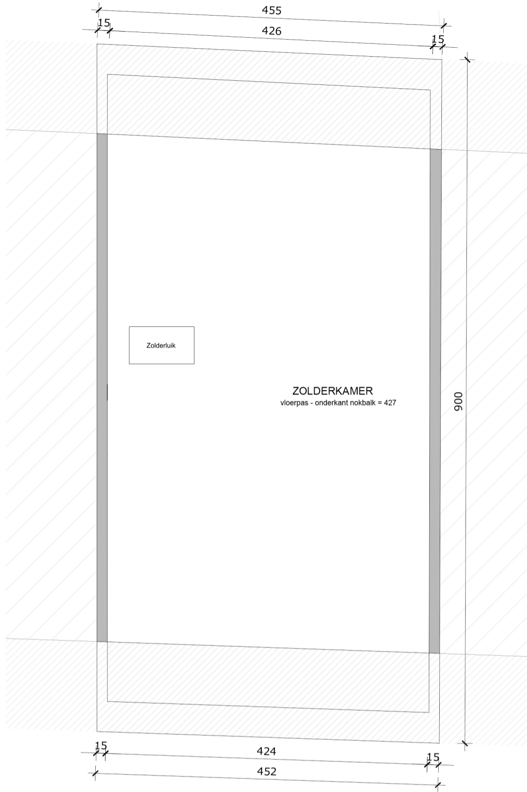
2e verdieping - zolder